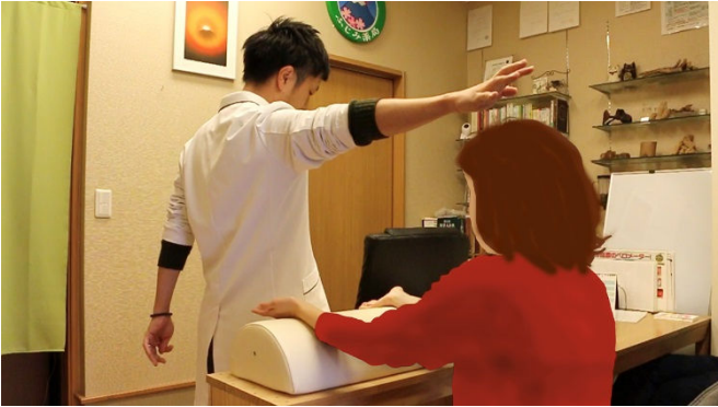
実際に糸練功を行っている様子

問診とは、簡単に言いますと、適切な漢方薬を選ぶために体質や病気の詳細を質「問」して「診」ということです。